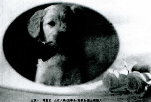
主攝人：釋聖玉 北京大學/醫學系/醫學系 博士候選人