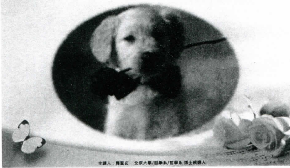
主講人：傅聖玄 北京大學/哲學系/哲學系 博士候選人