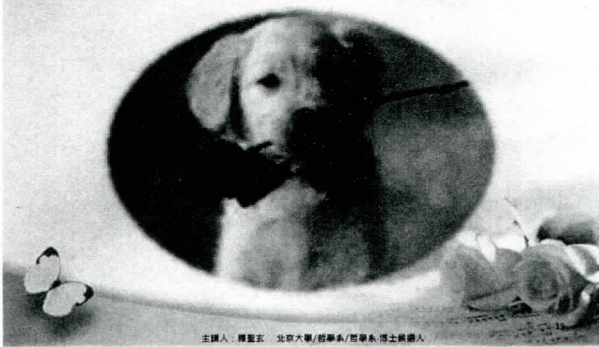
主攝人：羅聖玄 北京大學/哥倫比亞大學/哥倫比亞大學