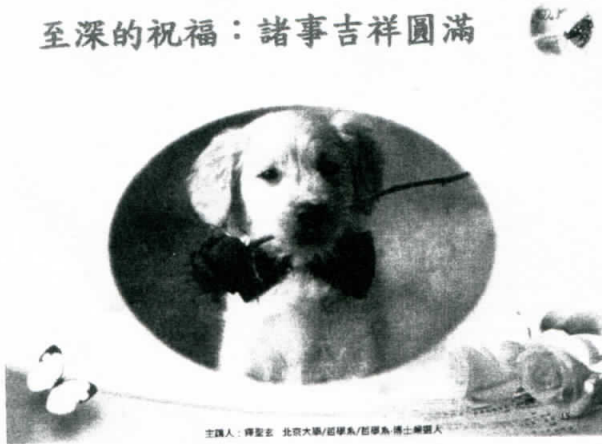
主攝人：釋聖玄 北京大學/留學美/留學德 博士候選人