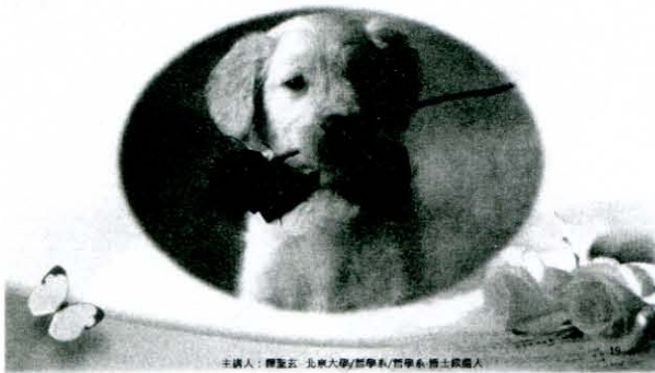
主講人：釋聖云 北京大學/哲學系/哲學系 博士候選人