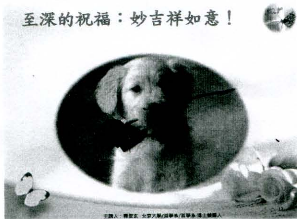
主講人：釋聖玄 北京大學/哲學系/哲學系 博士候選人