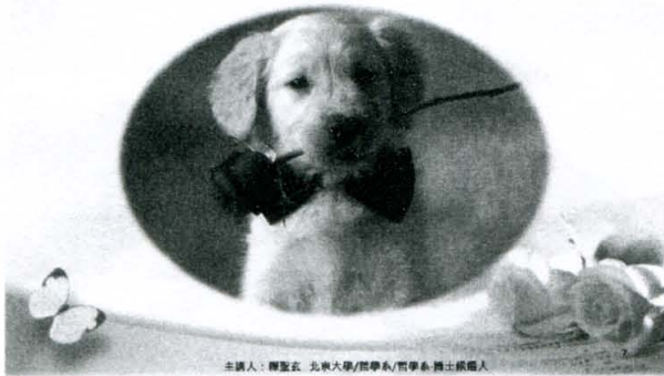
主講人：陳聖衣 北京大學/哲學系/哲學系 博士候選人